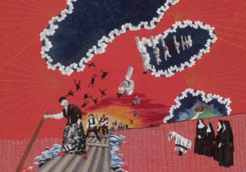
Daniela Hoferer, Holländer Michel, 2015, Stickerei auf Duchesse (Seidengewebe), Förderankauf der Kulturstiftung des Freistaates Sachsen | Daniela Hoferer, Holländer Michel, 2015, výšivka na hedvábné tkanině duchesse, pro Fond umění zakoupila Kulturní nadace Svobodného státu Sasko, © VG Bildkunst

25. Januar 2024 – 28. April 2024 Eröffnung: 24. Januar 2024